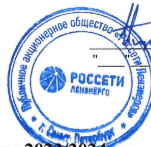
ГРАФИК временного отключения потребления на 2023/2024гг. по ПАО "Россети Ленэнерго" на территории г. Санкт-Петербурга